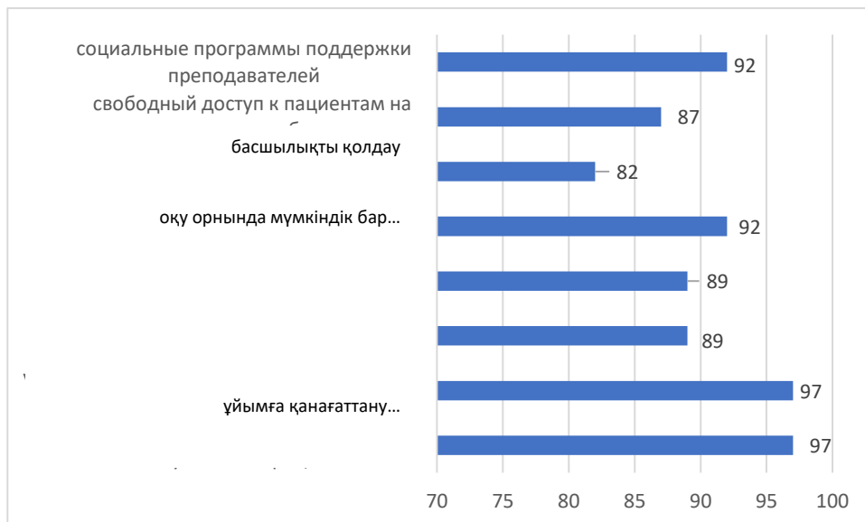
Диаграмма 4. Қолданбалы бакалавриат оқытушыларының сауалнамасы (n=78) в %

7 ЖМК 78 оқытушысының сауалнамасында барлық ұйымдастырушылық-әдістемелік және практикалық жағдайлар мен ресурстарға, сондай-ақ оқытушыларды қолдаудың әлеуметтік бағдарламаларына жоғары қанағаттану анықталды.