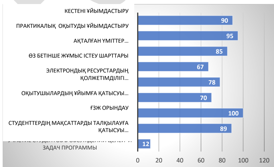
Диаграмма 3. Қолданбалы бакалавриат студенттерінің сауалнамасы (n=119) %

Кесте, ҒЗЖ ұйымдастыруға қанағаттану және оған оқытушылардың қатысуы, клиникалар мен емханаларда практикалық оқытуды ұйымдастыру, оқыту әдістерін респонденттер өте жоғары бағалады. Симуляциялық орталықтарды қоса алғанда, өз бетінше жұмыс жүргізу шарттары респонденттердің 2/3 бөлігін толық қанағаттандырады. Алайда, сыртқы сарапшылар анықтағандай, 7 ЖМК-нің 4-ші симуляциялық орталықтары кеңейтуді және толықтыруды қажет етеді. Барлық колледждерде студенттердің аудиториядан тыс уақытта симуляциялық орталықтарда практикалық дағдыларды пысықтау мүмкіндігі ұйымдастырылған жоқ. Сауалнамаға қатысқан студенттердің 20-30% - дан астамында бағдарлама тақырыптары бойынша оқу әдебиеттері, әсіресе электронды түрдегі әдебиеттер, сондай-ақ оқу әдебиеттерінің электрондық дерекқорларына қол жетімділік жетіспейді. Студенттер сауалнамаға қатысқан барлық ЖМК-да білім алушылардың білім беру бағдарламасының миссиясын, мақсаттары мен міндеттерін талқылауға қатысуының төмен деңгейі (12%) айқын проблема болып табылады. Сауалнамаға қатысқандардың шамамен 93-98%-ы тәлімгерлердің, кураторлардың, тьюторлардың қызметіне толық қанағаттанған және көптеген респондент студенттер колледж оқытушылары мен қызметкерлерінің білім алушыларға деген құрметін атап өтті.